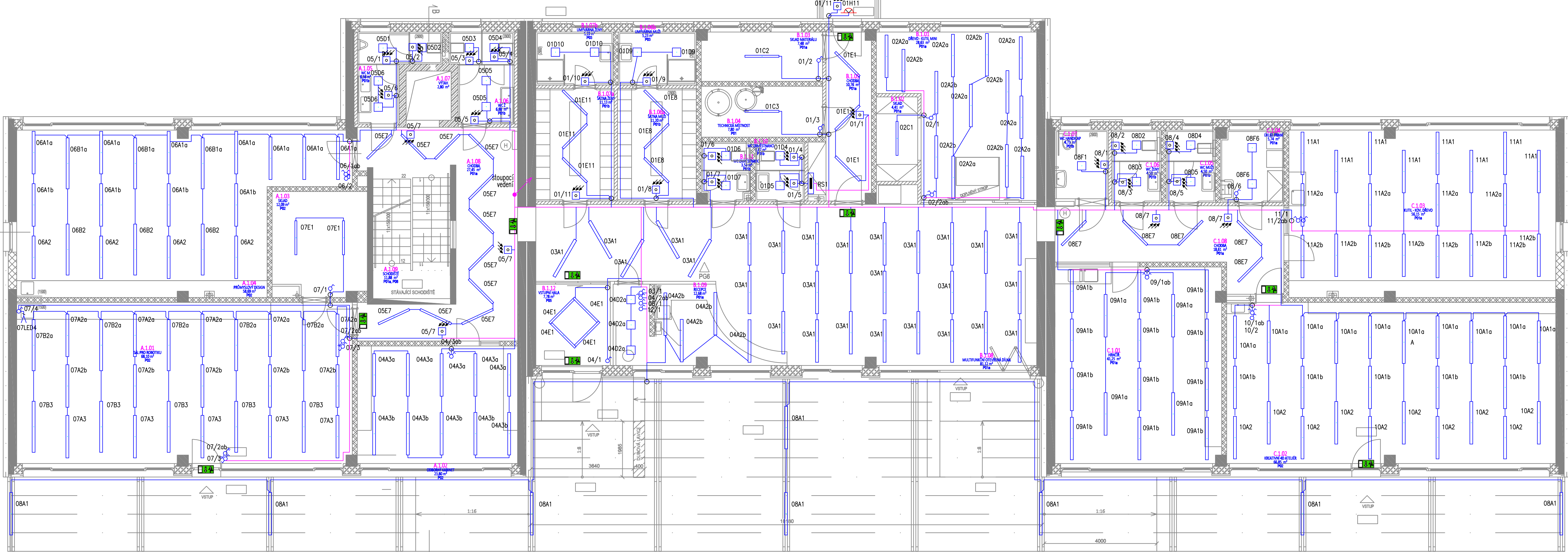
PAVILON 3 / SEKCE A PŮDORYS 1.NP